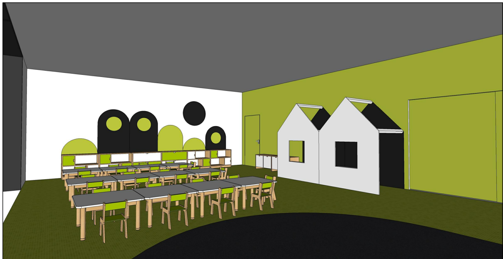
WIDOK 2 aranżacji wnętrza sali żłobka nr 2