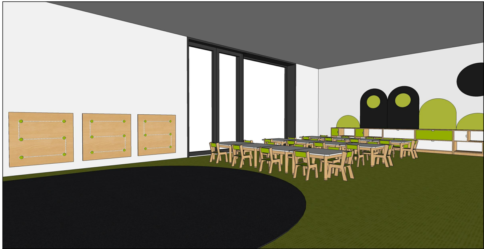
WIDOK 1 aranżacji wnętrza sali żłobka nr 2