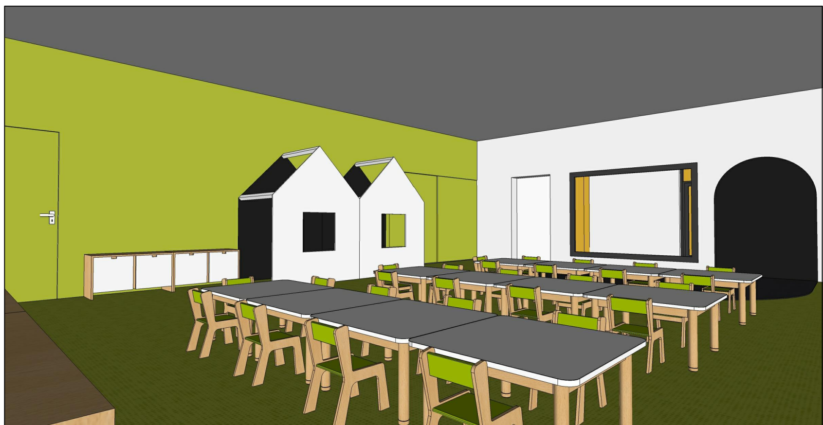
WIDOK 3 aranżacji wnętrza sali żłobka nr 2